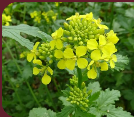
GELE MOSTERD REDUCEREND